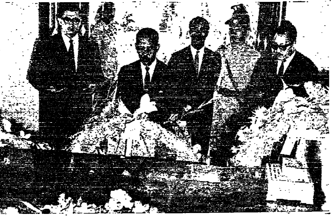
مجلس الوزراء في عمان يضم اعضاء المجلس من الوزراء والوزراء المفوضين

منذ مطلع العام القادم عنان - صرح السيد حاتم الرعي وزير الاقتصاد الوطني بان الاعتماد بالبطاقة الموحدة بين دول السوق العربية الموحدة اعتبارا من مطلع العام القادم . وقال ان الجهات المختصة تكلف حاليا على اعداد الترتيبات اللازمة لوضع هذه البطاقة موضع التنفيذ اعتبارا من (1-1-1978) .